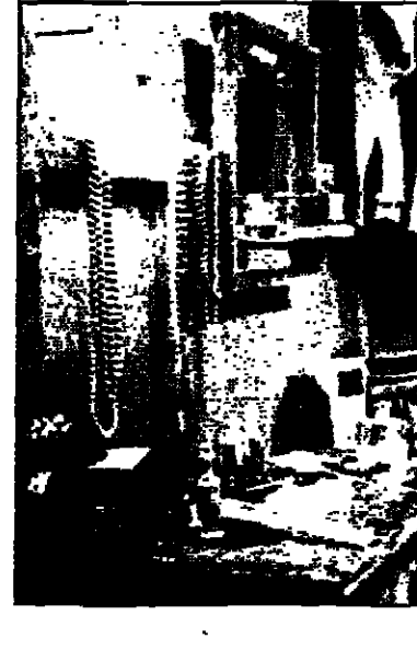
لغة من فيلم رجل الزمارة نوري بوزيد

بالإضافة الى افلام من ساحل اللعاج، افريقيا الجنوبية، هولندا، الخليلين، للنساء، اسبانية، والصين، مع مختبرات من افلام غريغري في مهرجانات لبشونة، ميلانو، الجوزاين، والخرى تعرض للمرة الاولى من الولايات المتحدة.